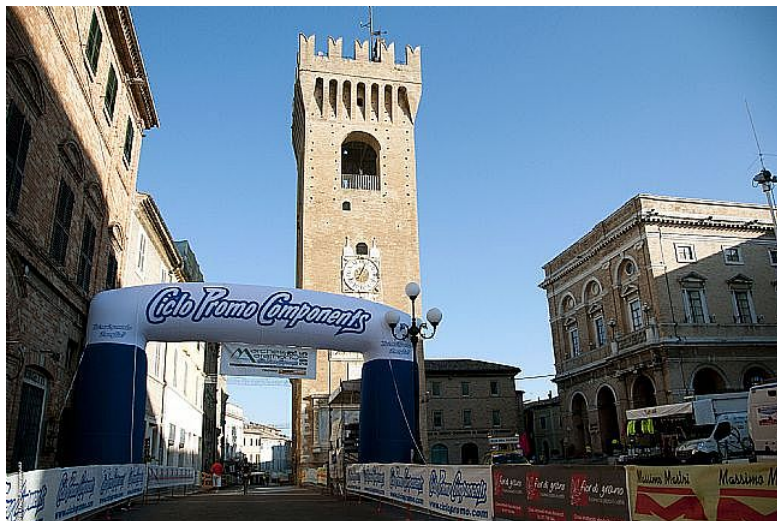
Posticipata all'8 settembre la chiusura del Marche Marathon

A causa di un'imprevista concomitanza con un'altra manifestazione che si terrà nel territorio recanatese il 1° settembre, il Ciclo Club Recanati è stato costretto a posticipare di una settimana il giorno di svolgimento dell'ultima prova del Marche Marathon.